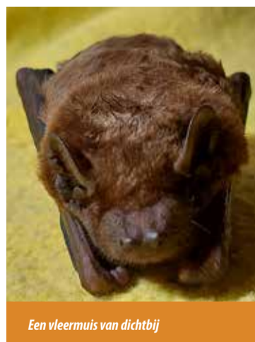
Een vleermuis van dichtbij