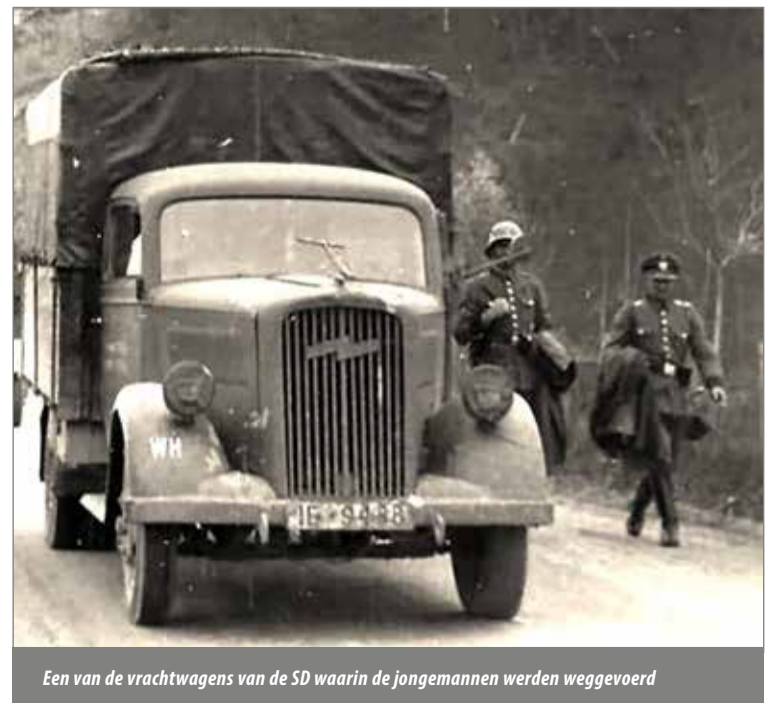
Een van de vrachtwagens van de SD waarin de jongemannen werden weggevoerd

Het was de grootste razzia in de noordelijke provincies naar aanleiding van een verzetsactie. De razzia was niet alleen in Zuidwolde maar ook in en om Bedum, Middelstum en Winsum. Zes mensen werden zonder vorm van proces doodgeschoten, ongeveer honderdvijftig meestal jonge mannen zijn opgepakt en weggevoerd. Ruim twintig van hen kwamen om. Voor de slachtoffers uit Zuidwolde staat een herdenkingsmonument in de tuin van café Moeke Vaatstra.