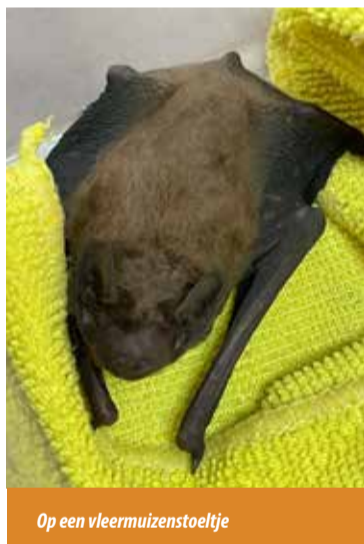
Op een vleermuisenstoeltje

ze dat op. Zo komen ze niet al te verzwakt weer uit die slaap. Binnen heb ik een aan een poot gewond vleermuisje, dat gewoon wakker is en veel zorg nodig heeft. Dan smeer ik het pootje voorzichtig in met helende crème en borstel het lijfje met een tandenstokerborsteltje, dat vindt ze heerlijk. Het is een echt druktemakertje dat voortdurend luidkeels om aandacht vraagt. [Helaas heeft het vleermuisje het niet gered, het is een week na het interview overleden.]