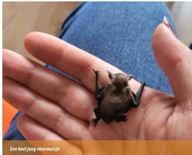
Een heel jong vleermuisje

uur zoet met voeding geven. Als je dan ook nog een baan hebt, is dat een zware belasting. Sinds een aantal jaren werk ik op woensdag, vrijdag en eens per twee weken op zaterdag bij bakker Meindertsma in Beijum. Ook heb ik vier jaar