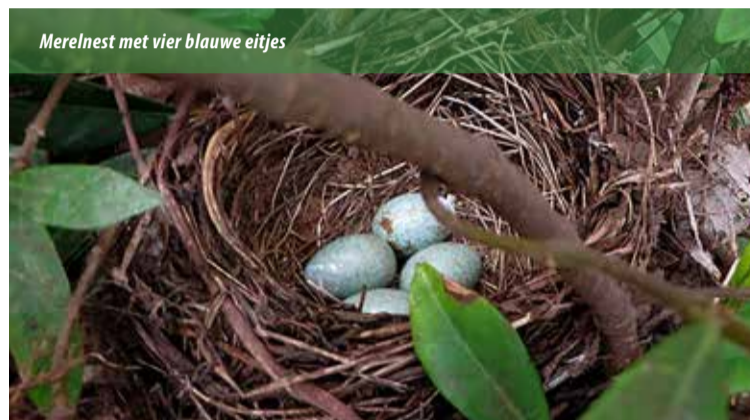
Merelnest met vier blauwe eitjes

Halfholenbroeders zijn onder andere het roodborstje, de winterkoning en de merel. Zij maken hun nest het liefst in een inham tussen dichte gevelbegroeiing, struikgewas, een boom of een nis van een muur. Het is een open nest van grassen, bladeren en kleine takjes, dat makkelijk toegankelijk is. De winterkoning heeft een bolvormig nest met veel mos, met aan de zijkant