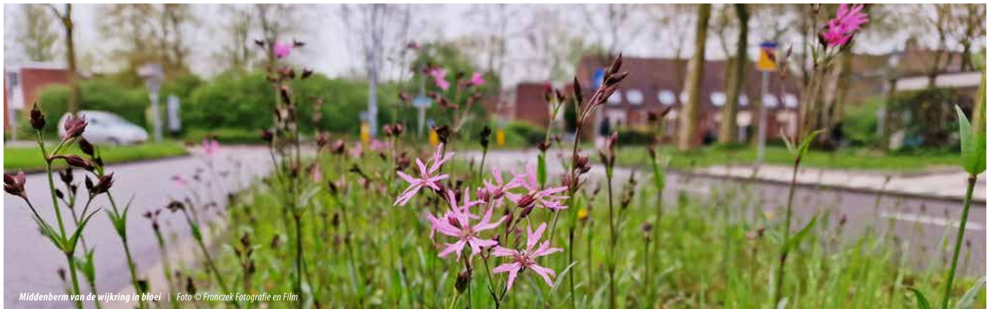
Middenberm van de wijkkring in bloei