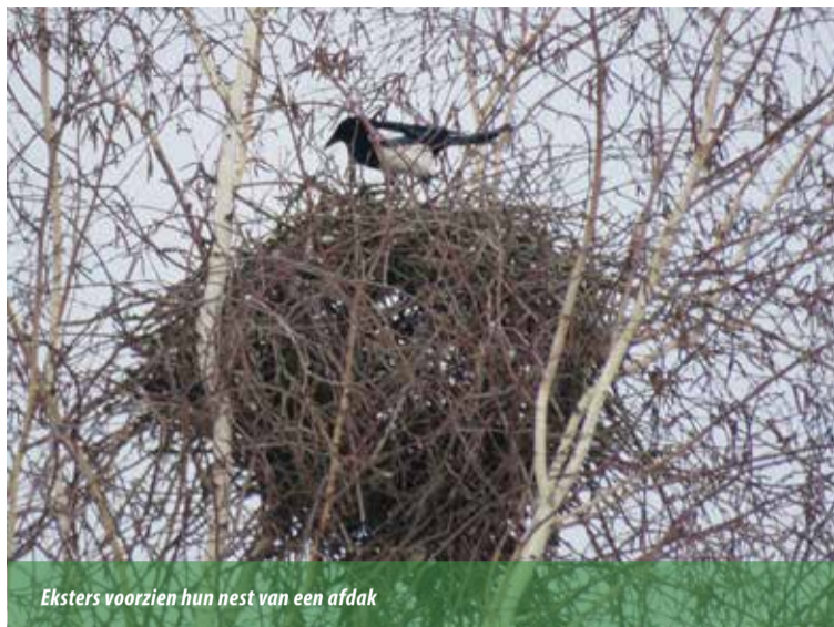
Eksters voorzien hun nest van een afdak

Zwarte kraaien leven 's winters in groepen, maar vormen in de lente paartjes en zijn dus geen koloniebroeders, in tegenstelling tot roeken. Het nest is een vrij grote constructie en wordt hoog in een boom gemaakt. Eind maart of begin april begint het kraaienkoppel een nest te bouwen. Een verzameling dunne twijgen en dikkere takken wordt tot een platform in elkaar gevlochten en verstevigd met modder.