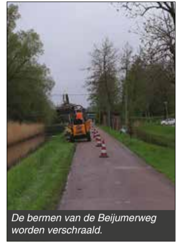
De bermen van de Beijumerweg worden verschaald.

Ook worden er op een aantal plekken bomen aangeplant. Het gaat om elzen en knotwilgen. De werkzaamheden duren tot eind april.