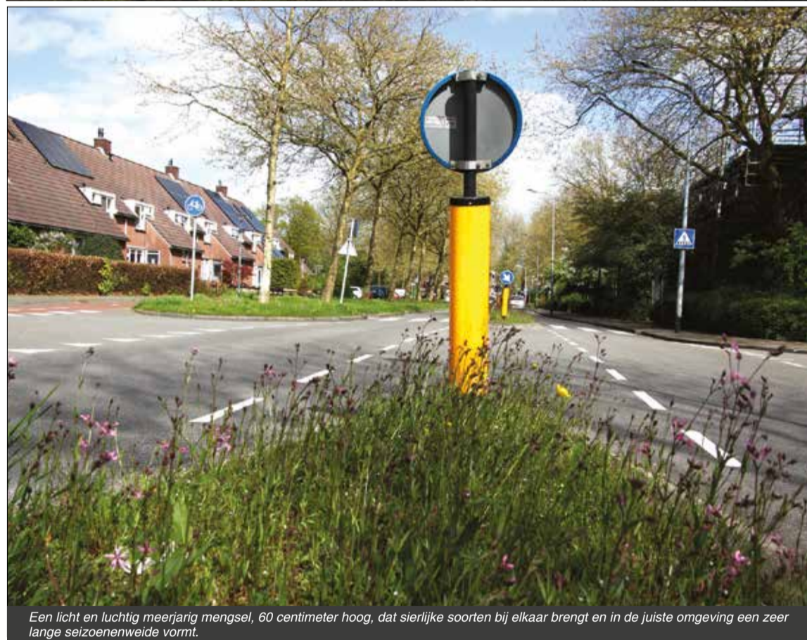
Een licht en luchtig meerjarig mengsel, 60 centimeter hoog, dat sierlijke soorten bij elkaar brengt en in de juiste omgeving een zeer lange seizoenenweide vormt.