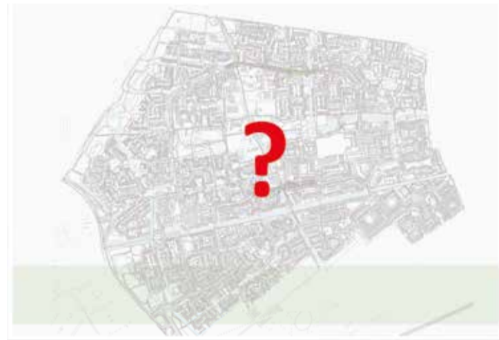
Waar komt het nieuwe kunstwerk in Beijum?

Wil je graag meedenken of meedoen met de werkgroep? Stuur dan voor zondag 12 mei een e-mail naar: communicatiebeijum@ groningen.nl Heb je ideeën of suggesties voor het kunstwerk? Of wil je graag op de hoogte gehouden worden? Ook dat horen we graag via bovenstaande e-mailadres.