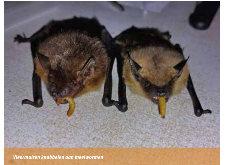
Vleermuizen knabbelen aan meelwormen

bijna fulltime gewerkt in het dorps huis in Adorp. In die tijd had ik regelmatig een vleermuisje in mijn bh en voeding in de broekzak of, voor het evenwicht, aan de andere kant in de bh, haha.