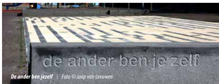
De ander ben jezelf

Bezorgklachten De bezorger van De Beijumer doen hun best om de krant correct te bezorgen. Klachten over de bezorging kunt u bij ons melden via tel.nr.: 050-5422807