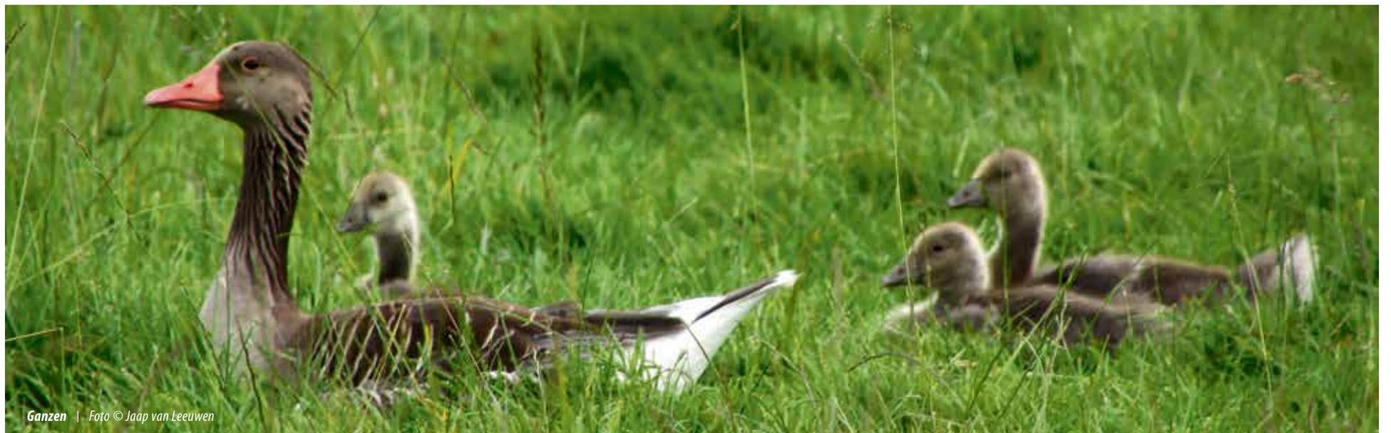
Ganzen | Foto © Jaap van Leeuwen