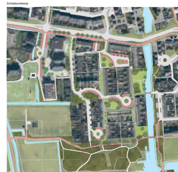
Wijkvernieuwing Beijum - Heerdenaanpak Onnemaheerd

Bijvoorbeeld over het groen en de invulling van de parkeerplekken. Daarnaast gaan we het ontwerp toetsen op wenselijkheid en financiële haalbaarheid. Op basis hiervan maken we een definitief ontwerp.