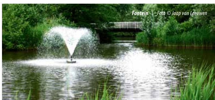
Fontein | Foto © Jaap van Leeuwen