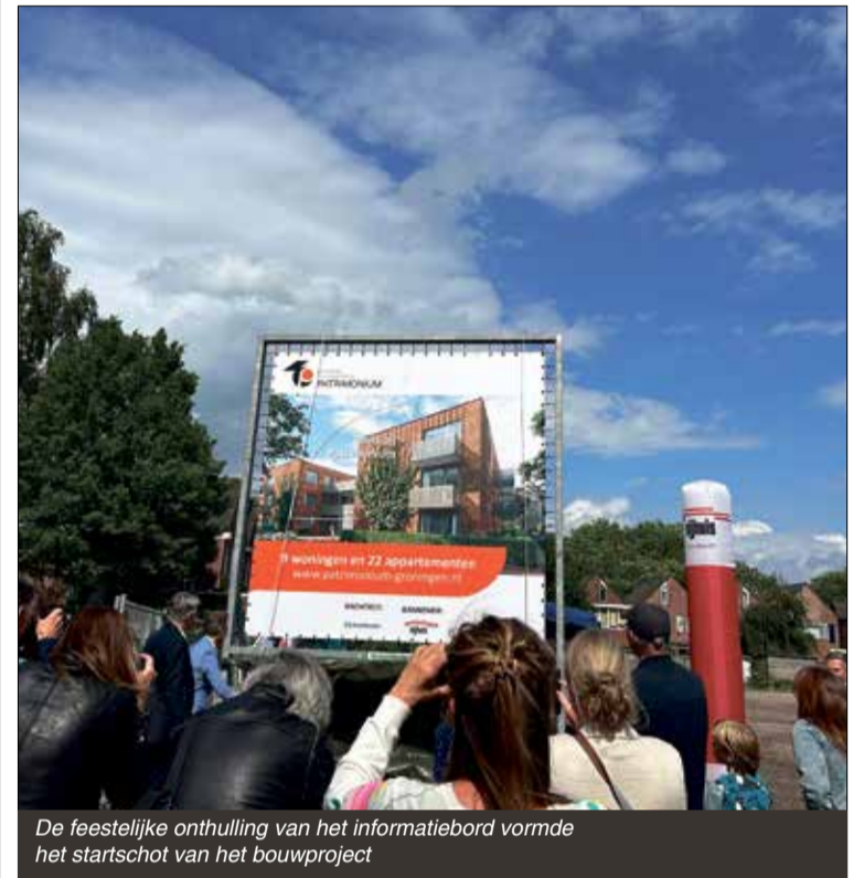
De feestelijke onthulling van het informatiebord vormde het startschot van het bouwproject

Woensdag 28 mei was het officiële startschot van het nieuwbouwproject 'Doefmat' aan de Isebrandtsheerd in Beijum. Woningcorporatie Patrimonium gaat hier negen eengezinswoningen en 22 appartementen bouwen.