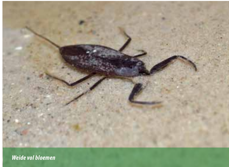
Weide vol bloemen

Amfibieën zijn koudbloedige dieren. Anders dan reptielen leven zij grotendeels in het water. Hun dunne huid heeft verschillende functies. Hij bevat veel klieren en die houden de huid vochtig. Daarnaast speelt