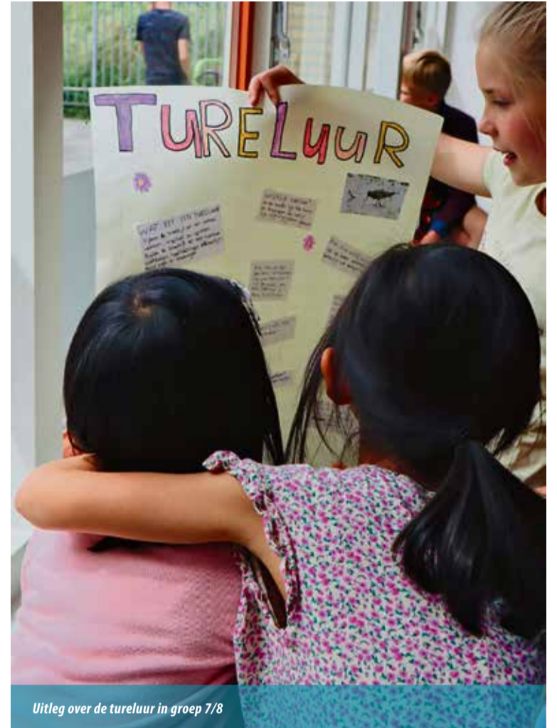
Uitleg over de tureluur in groep 7/8